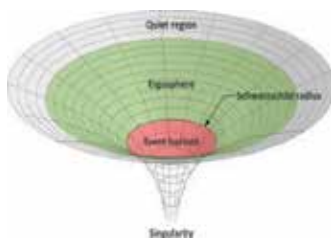
Shape of a Black hole (seigel .2021)

नीचे दिये गये चित्र में, एक ब्लैक होल के दृश्य में, आप घटना छतिजि की छवि देख सकते हैं: